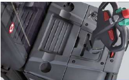
Espace de stockage diversifié, documents ou presse-papiers...etc.