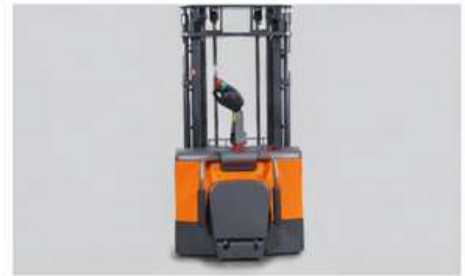
Plateforme pliable pour une grande flexibilité dans les espaces étroits.