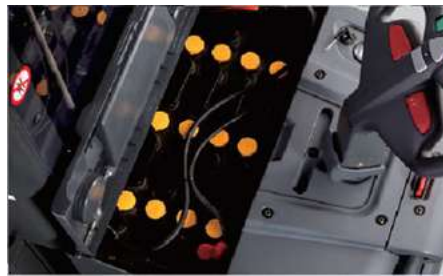
Batterie de 24V une capacité jusqu'à 350Ah, haute performance pour une opération longue durée.