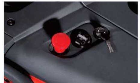
Bouton arrêt d'urgence, niveau de batterie et clés pour démarrage du gerbeur.