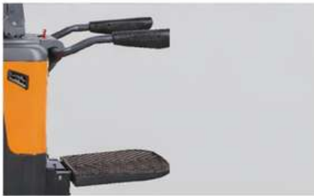
Plateforme avec bras de protection, les plateformes rembourrées garantissent la sécurité dans toutes les conditions d'utilisation.