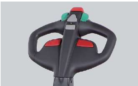
Poignée de commandes ergonomique avec bouton d'arrêt d'urgence central, il empêche que l'opérateur ne se retrouve coincé en faisant brièvement reculer le chariot lorsqu'il est activé.